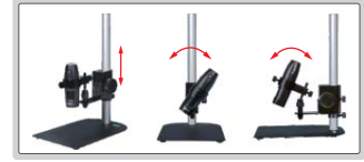
opsiyonel stand (kod: ISM-WSTD)