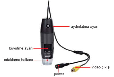
ISM-TV200-P (kablo ile)