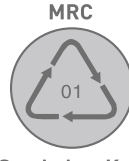
Sembol ve Kod