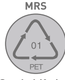
Sembol, Kod ve Marka

• Yeniden kullanımı mümkün olan plastik ürünlerin tanımlanmasında kullanılır. Mühürler ham maddenin kolayca tanınmasını sağlar.