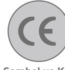
Sembol ve Kod