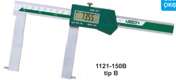
1121-150B tip B