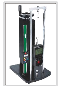
dijital ölçek (opsiyonel)