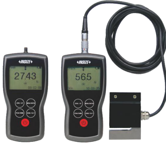
ISF-DF100A tip A