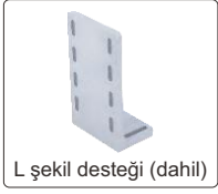
L şekil desteği (dahil)