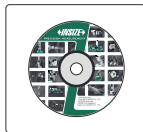
yazılım CD'si (dahil)