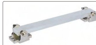
bağlama braketleri (dahil)