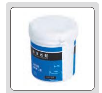
sıcak montaj reçinesi (isteğe bağlı)