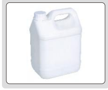
soğutma sıvısı (isteğe bağlı)