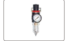
basınç ayar valfi (opsiyonel)