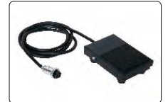
ayak pedalı (opsiyonel)