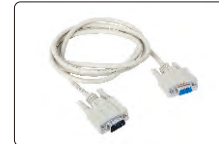
RS232 kablosu (opsiyonel)