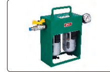
hava filtresi (opsiyonel)