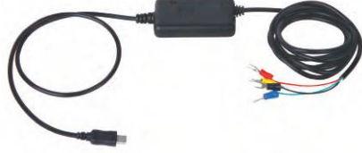
dijital komparatör saati kablosu 7309-B01M