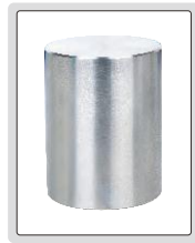
ISH-S30D için 4kg ağırlık bloğu (opsiyonel)