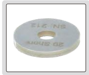
kalibrasyon bloğu (dahil)