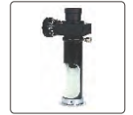
ölçme mikroskobu (dahil)