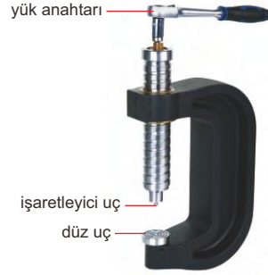
statik test kelepçesi